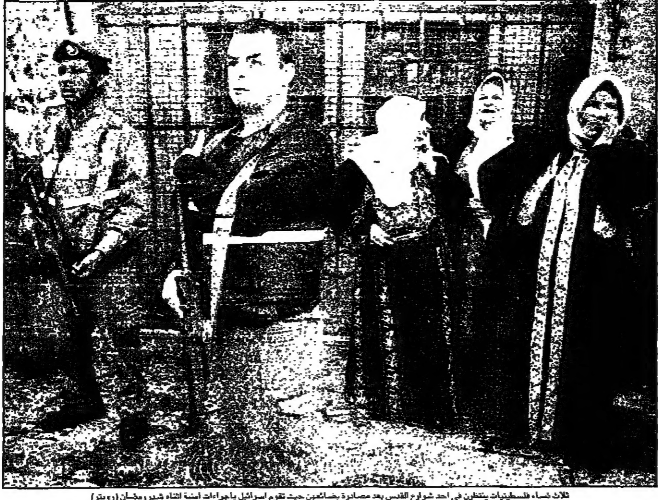
ثلاثاء، فلسطينيات يتلقين في أحد شوارع القدس بعد مسامرة مصفاة من قبل أبو مازن في اجتماعه مع وفد روس في القدس (رويتز)